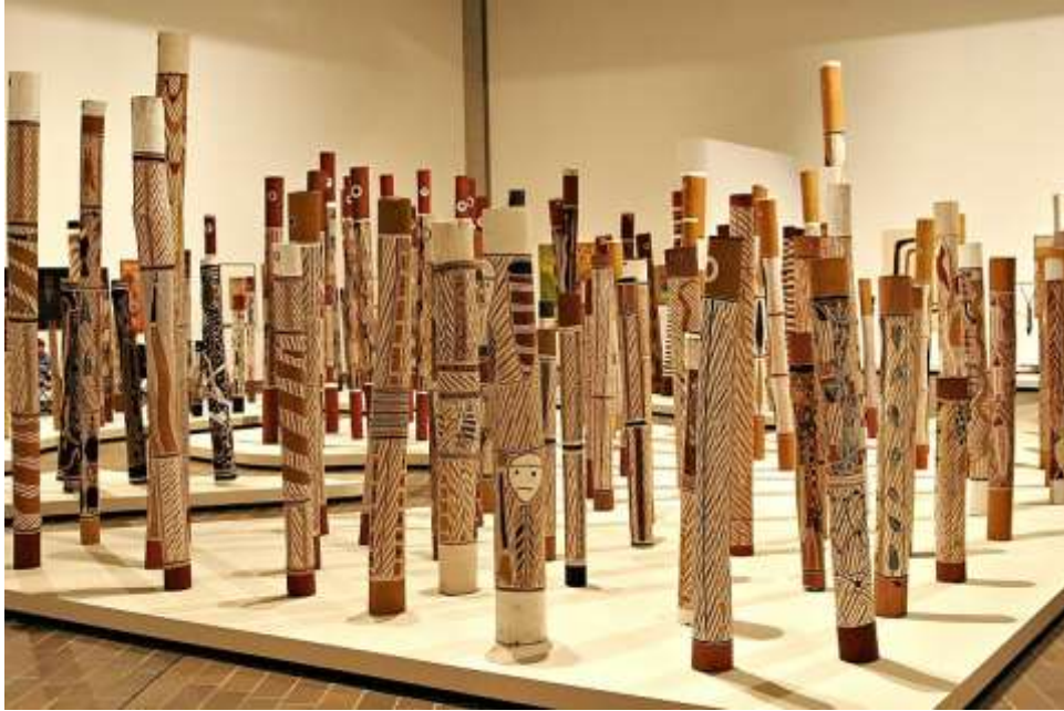
Aboriginal hollow log tombs - National Gallery Canberra - 2005